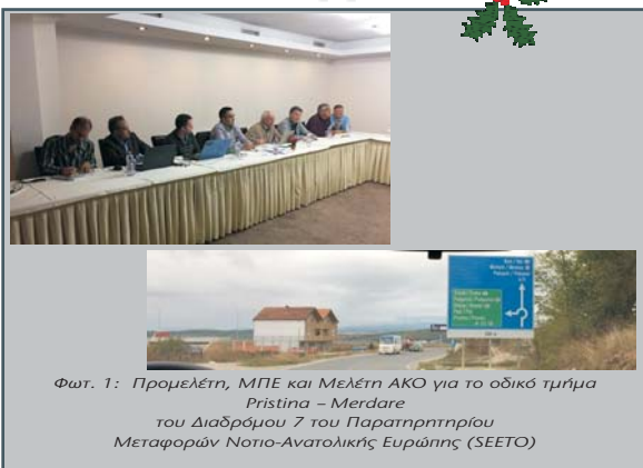
Φωτ. 1: Προμελέτη, ΜΠΕ και Μελέτη ΑΚΟ για το οδικό τμήμα Pristina - Merdare του Διαδρόμου 7 του Παρατηρητηρίου Μεταφορών Νοτιο-Ανατολικής Ευρώπης (SEETO)