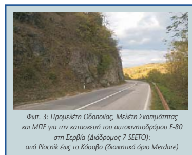
Φωτ. 3: Προμελέτη Οδοποιίας, Μελέτη Σκοπιμότητας και ΜΠΕ για την κατασκευή του αυτοκινητόδρομου E-80 στη Σερβία (Διάδρομος 7 SEETO): από Plocnik έως το Κόσοβο (διοικητικό όριο Merdare)