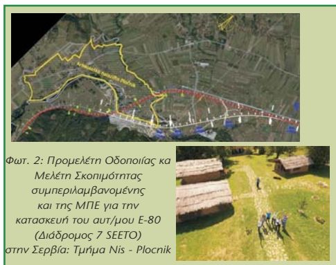
Φωτ. 2: Προμελέτη Οδοποιίας και Μελέτη Σκοπιμότητας συμπεριλαμβανομένης και της ΜΠΕ για την κατασκευή του αυτοκινητόδρομου E-80 (Διάδρομος 7 SEETO) στην Σερβία: Τμήμα Nis - Plocnik

Το έργο αποτελεί μέρος του οδικού διαδρόμου που ενώνει τη Μαύρη Θάλασσα μέχρι την Αδριατική. Το τμήμα Nis- Merdare (διοικητικά σύνορα με Κόσοβο) αποτελεί έργο προτεραιότητας για την Σερβική κυβέρνηση. Η συγκεκριμένη μελέτη αφορά στο υπομήμα 40 χλμ. Nis - Plocnik.